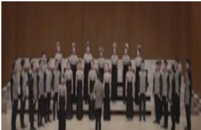
Gambar 1. Chior sebelum Pandemi oleh Universitas Negeri Manado

Pada masa pandemi ini perubahan dalam pelatihan paduan suara menggunakan berbagai cara secara virtual dimasa peraturan pemerintah untuk tetap tinggal dirumah selama kurang lebih tiga bulan yang dimulai pada bulan Maret tahun 2020. Menghadapi situasi seperti ini, Paduan Suara Universitas Manado tetap terus berlatih meski dengan cara virtua, para anggota berlatih bernyanyi dirumah masing-masing.