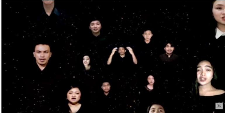
Gambar 2. Contoh choir secara virtual, editing vidio choir festival oleh Unima

Paduan Suara Universitas Negeri Manado dilaksanakan secara virtual, dengan saling berlatih secara sendiri-sendiri dirumah masing dan langsung dipandu oleh pelatih. Penggunaan aplikasi zoom yang bisa memuat lebih banyak dan jelas untuk jenis suara yang ada pada anggota Paduan Suara Universitas Negeri Manado. Kedisiplinan dan perilaku yang berbeda akan kondisi sekaran ini membuat rasa tanggung jawab akan kedisiplinan dalam berlatih menjadi tinggi.